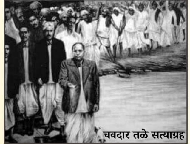
चवदार तळे सत्याग्रह

“चवदार तळ्याचे पाणी प्याल्याने तुम्ही आम्ही अमर होणार नाही. इतरांप्रमाणे आम्हीही माणसे आहोत हे सिद्ध करण्याकरिताच त्या तळ्यावर आपणास जायचे आहे.”